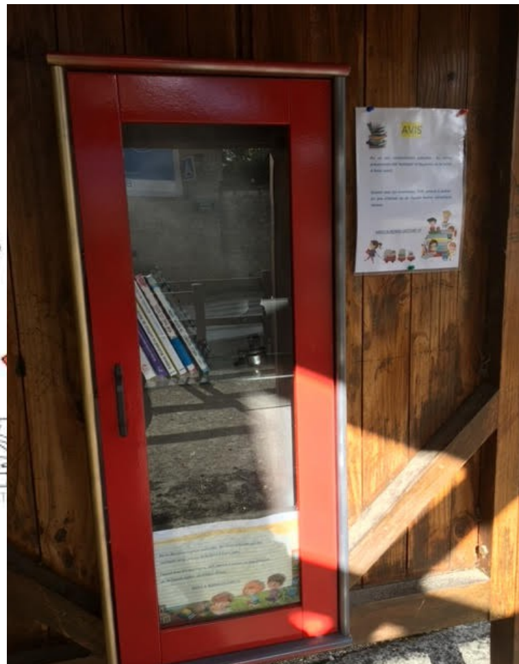
Boîte à livres